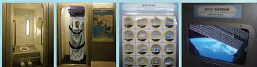
宇宙トイレ 宇宙ベッド 4ヶ国の宇宙食 「きぼう」からの眺め

日本が独自で開発した宇宙実験棟「きぼう」。この「きぼう」をイメージした空間の中で、宇宙でのトイレやベッド、4ヶ国の宇宙食等、宇宙での「衣・食・住」をご覧いただけます。