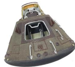
アポロ司令船 (1/24スケールモデル)