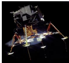
アポロ着陸船 (1/48スケールモデル) *写真はイメージです