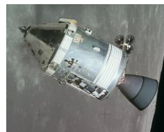
アポロ司令・機械船 (1/48スケールモデル) *写真はイメージです