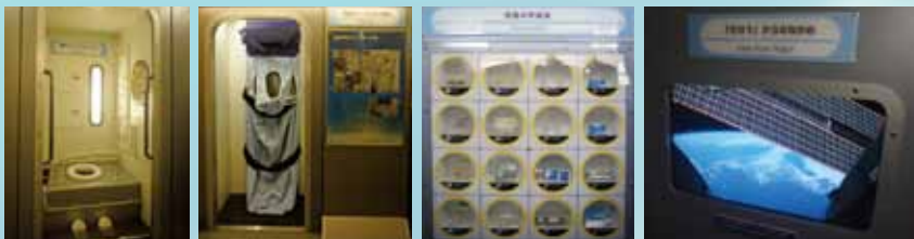
宇宙トイレ 宇宙ベット 4ヶ国の宇宙食 「きぼう」からの眺め