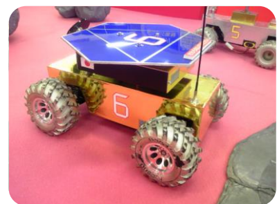
月面ローバーの操縦を体験しよう！

住所：〒046-0003 余市郡余市町黒川町6丁目4番地(道の駅内)、電話：0135-21-2200