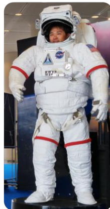
アメリカ船外活動用宇宙服(レプリカ) 顔を出して記念写真を撮ろう！