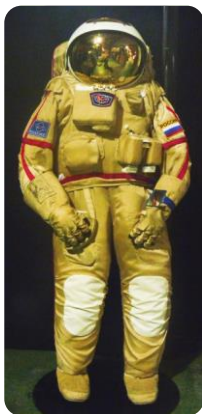
ロシア船外活動用宇宙服(レプリカ)