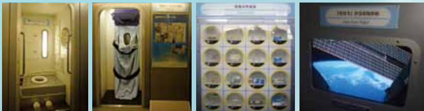
宇宙トイレ 宇宙ベット 4ヶ国の宇宙食 「きぼう」からの眺め